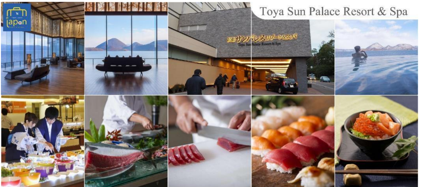
Toya Sun Palace Resort & Spa

ที่พัก TOYA SUN PALACE RESORT & SPA หรือเทียบเท่าระดับเดียวกัน